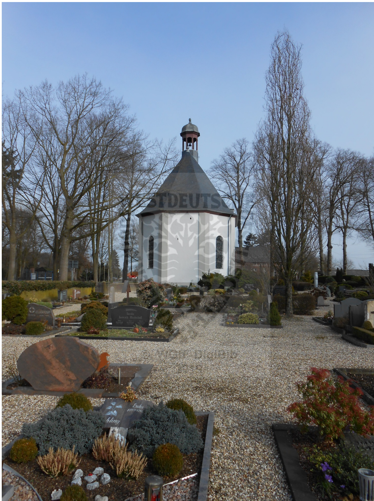
Friedhof in Moyland: Foto Privatsammlung des Autors